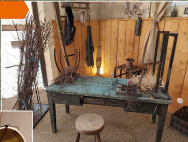
L'Atelier de Greffe ▶