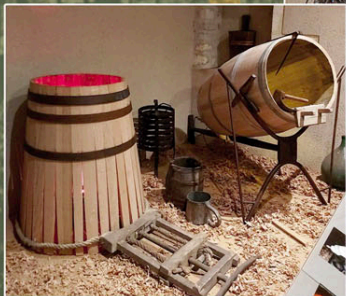
◀ La Tonnellerie

Deux nouvelles salles vous font découvrir les outils et les procédés du greffage ainsi que les étapes de fabrication de la Tonnellerie.